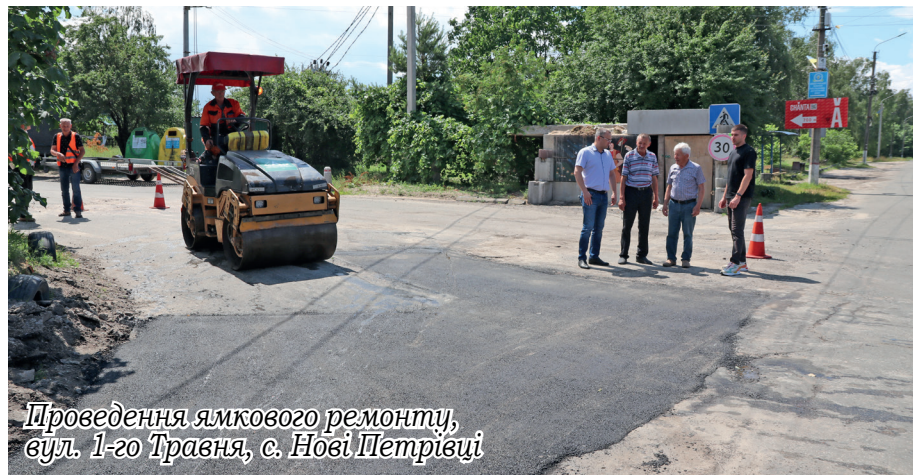
Проведення ямкового ремонту, вул. 1-го Травня, с. Нові Петрівці

У результаті проведених перевірок були зафіксовані численні порушення з боку власників домогосподарств. На порушників було складено 386 приписів і надіслано 1290 повідомлень. Це свідчить про значну кількість випадків, коли громадяни не виконували встановлені вимоги щодо утримання своїх територій у належному стані.