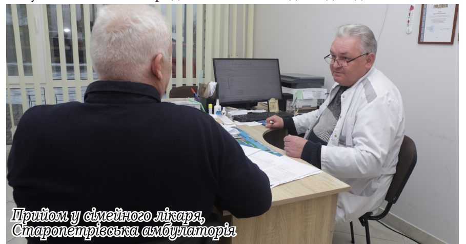
Прийом у сімейного лікаря, Старопетрівська амбулаторія

Проведено розгляди справ по ЛКК: видано довідок, висновків –