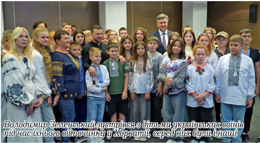
Володимир Зеленський зустрівся з дітьми українських воїнів під час їхнього відпочинку у Хорзаті, серед них були і наші

Служба у справах дітей здійснює роботу щодо ведення єдиної інформаційно-аналітичної