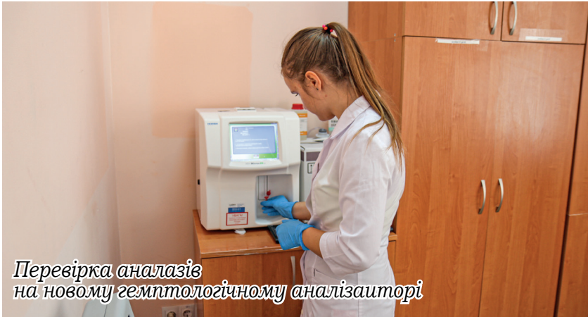
Перевірка аналізів на новому гемптологічному аналізаторі

На початку вересня 2024 року заклад було перевірено акреди-таційною комісією при Департа-