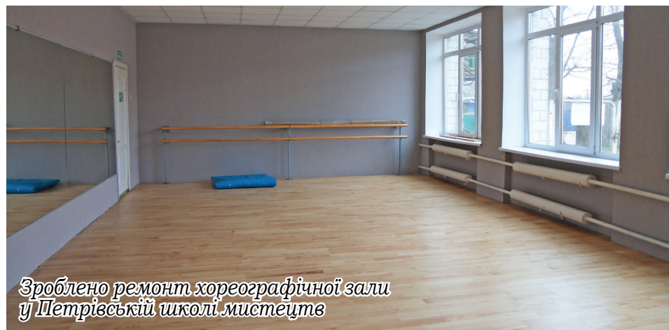
Зроблено ремонт хореографічної зали у Петрівській школі мистецтв

домра і духові інструменти); вокально-хоровий (академічний та естрадний спів); відділ мистецтв (театральне, образотворче, хореографічне сучасне та народне).