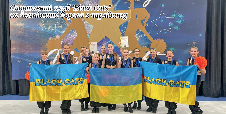
Спортивний клуб "Black Cats" на чемпіонаті Європи з чирлідінгу

Завдяки старанній праці викладачів учні Петрівської школи мистецтв регулярно підтверджують