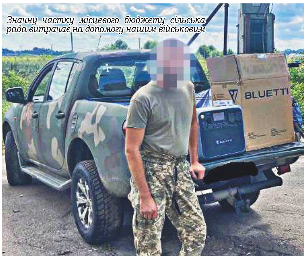
Значну частку місцевого бюджету сільська рада витрачає на допомогу нашим військовим

За програмою "єВідновлення" нараховано компенсацію за пошкоджені житлові будинки у сумі 7 965 355 грн, за знищені - по 5 заявах сформовано грошову компенсацію на загальну суму 9 619 590 грн, по 17 заявникам надано житлові сертифікати на загальну суму 50 095 709 грн.