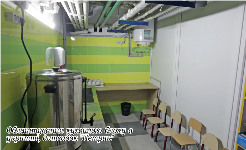
Облаштування кухонного блоку в укритті, дитсадок "Петрик"

Прогресивним кроком стимулювання обдарованих учнів та вчителів є запровадження Петрівською сільською радою сти-