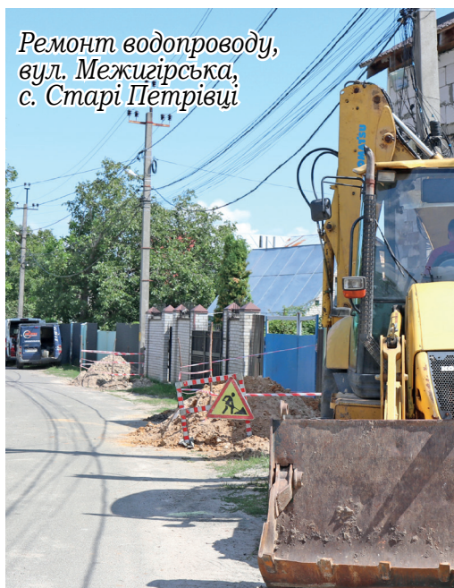
Ремонт водопроводу, вул. Межигірська, с. Старі Петрівці