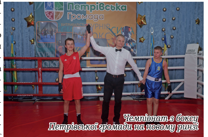
Чемпіонат з боксу Петрівської громади на новому ринзі

Протягом року було прове-дено 32 культурні заходи та 21 спортивний захід. Вихованці за-кладів взяли участь у 58 виїзних конкурсах, змаганнях і фести-валях, здебільшого посідаючи призові місця. Двоє вихованців секції армспорту та один вихова-нець секції боксу отримали зван-ня «Кандидат у майстри спорту України». Один працівник був нагороджений подякою Міні-стерства молоді та спорту Украї-