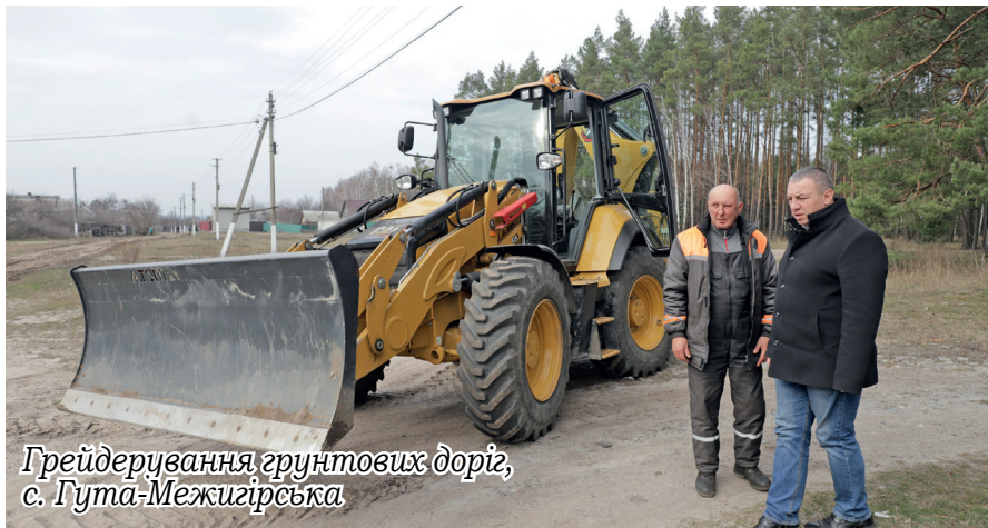
Грейдерування ґрунтових доріг, с. Гута-Межигірська

Працівники КП «ПЕТРІВСЬКИЙ БЛАГОУСТРІЙ» забезпечують прибирання зупинок гро-