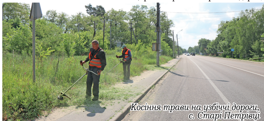
Косіння трави на узбіччі дороги, с. Старі Петрівці

Виконано ямковий ремонт – 1950 м 2 , оновлено дорожню розмітку – 1,8 тис. м 2 , замінено 15 дзеркал та 18 дорожніх знаків. Також здійснювались роботи з