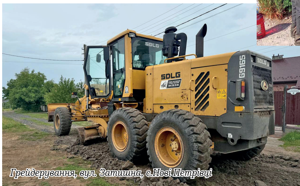
Грейдеравання, вул. Затишна, с.Нові Петрівці