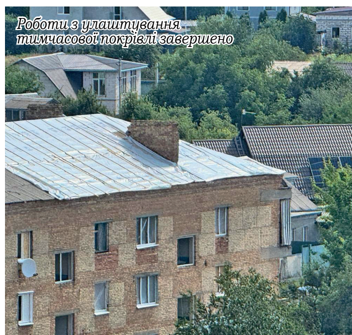
Роботи з улаштування тимчасової покрівлі завершено