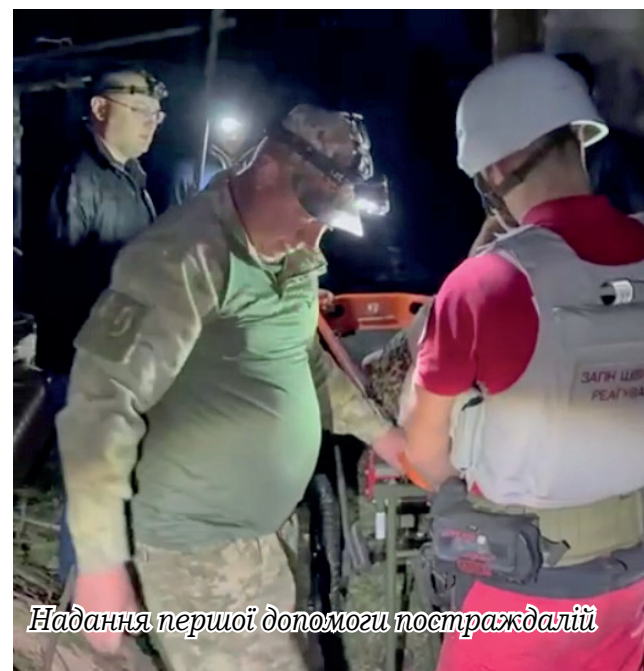
Надання першої допомоги постраждалій