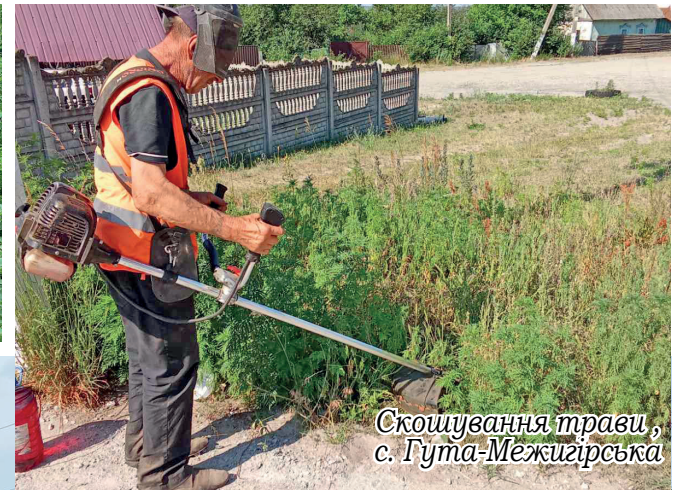
Скошування трави, с. Гута-Межигірська