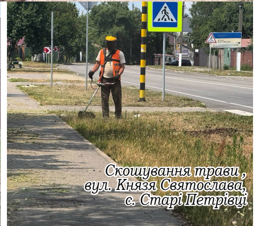
Скошування трави, вул. Князя Святослава, с. Старі Петрівці