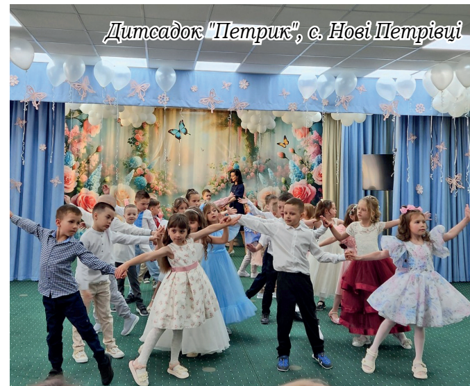
Дитсадок "Петрик", с. Нові Петрівці