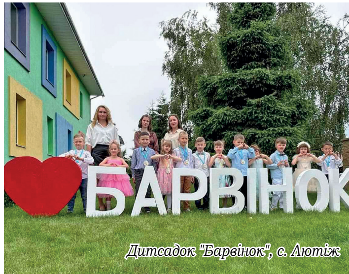
Дитсадок "Барвінок", с. Лютіж