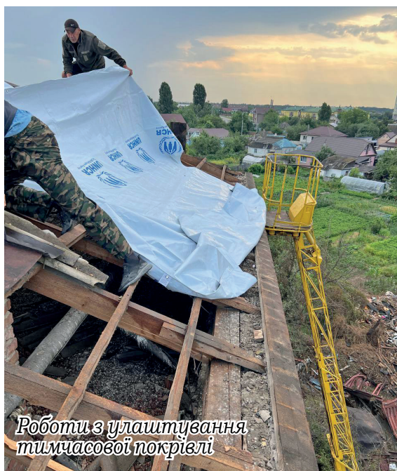
Роботи з улаштування тимчасової покрівлі

Ми не можемо зупинити ракети. Але можемо бути поруч, допомагати і відбудовувати. Бо наша сила — в єдності, дії й турботі одне про одного.