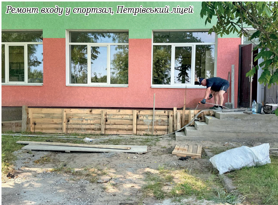
Ремонт входу у спортзал, Петрівський ліцей