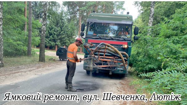
Ямковий ремонт, вул. Шевченка, Лютіж