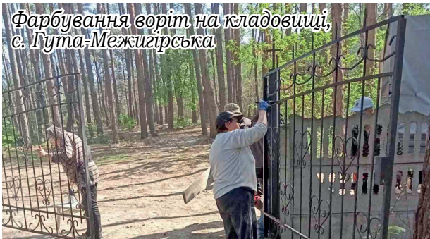
Фарбування воріт на кладовищі, с. Гута-Межигірська

Підсумовуючи, можна сказати: двомісячник благоустрою показав – чистота, порядок і добробут у громаді починаються з ініціативи, спільної праці й відповідальності. І хоч не всі пункти плану вдалося реалізувати в повному обсязі через погодні умови, основні завдання виконані. І це – результат злагодженої роботи комунальників, старост, відповідальних працівників і, звичайно, небаждужих жителів.