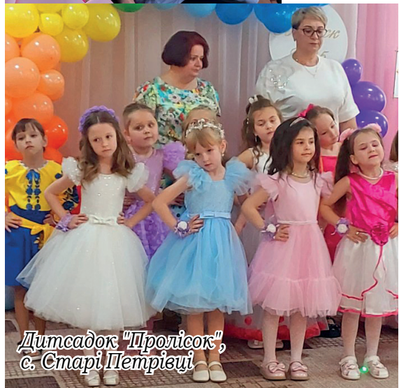
Дитсадок "Пролісок", с. Старі Петрівці