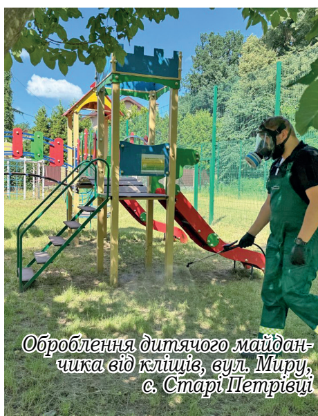
Оброблення дитячого майданчика від кліщів, вул. Миру, с. Старі Петрівці