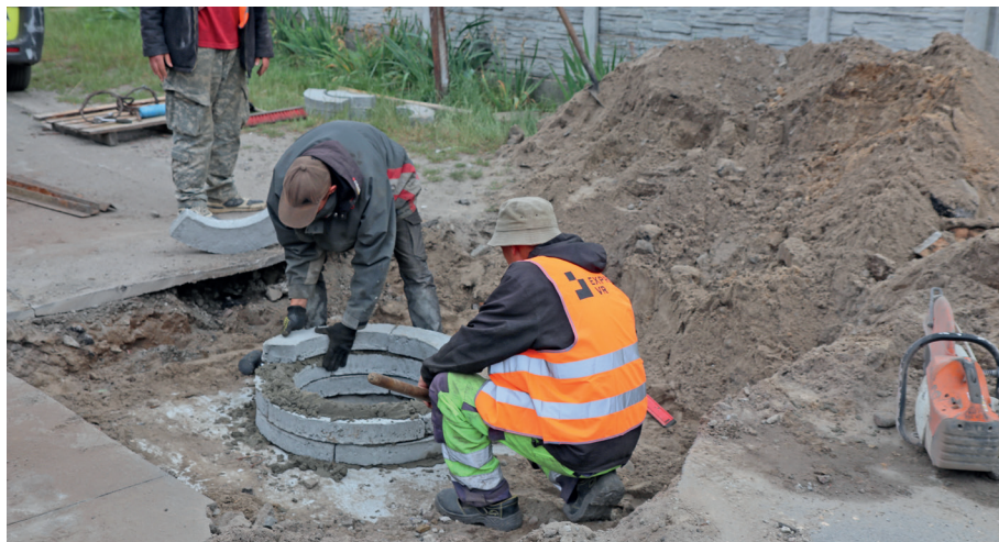
Заміна люка, вул. Леоніда Каденюка, с. Старі Петрівці

Працівники КП "Петрівський благоустрій" ліквідували стихійні сміттєзвалища, прибирали вулиці, тротуари, громадські місця та узбіччя від сміття й по-