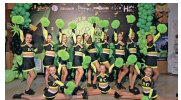
Гуртки і секції для дітей і дорослих читайте на стор.7-8