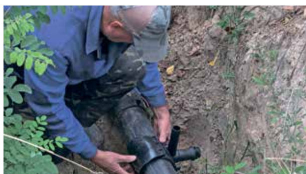
Фінансування важливих потреб громади читайте на стор. 3