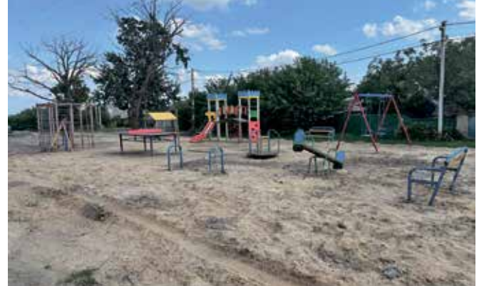
Відремонтовано дитячий майданчик, вул. Жовтнева, с. Старі Петрівці

• КЗ "Культурно-освітній центр "Берегиня" — придбання сценічних костюмів та проведення заходу до 1050-ї річниці заснування села Лютіж.