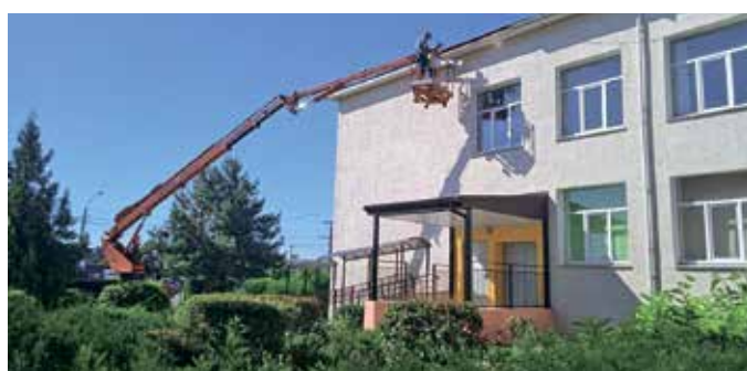
Облаштування водостічної системи у Лютізькому ліцеї

• на новий підйомник для людей з інвалідністю та мам з дитячими візочками, який зробить відвідування медзакладу комфортнішим і доступнішим для всіх мешканців громади (раніше куплений підйомник, на жаль, вийшов з ладу, тож вирішили купити якісніший).