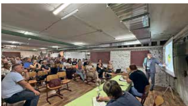
Щодо затвердження генплану у с. Старі Петрівці читайте на стор. 2