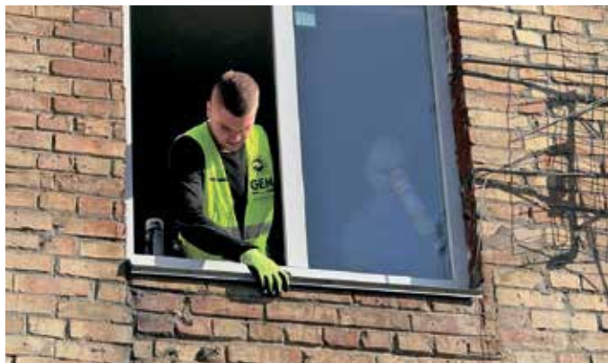
Заміна вікон на вул. Захисників України, 21, с. Нові Петрівці

• 552 750 грн – на виготовлення QR-кодів із відео про загиблих Героїв, які будуть розміщені на банерах та пам'ятниках.