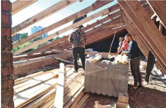
Ремонт даху пошкодженого будинку у с. Нові Петрівці

• 1 500 000 грн – субвенція Вишгородському районному бюджету на посилення заходів фортифікаційного захисту північних оборонних рубежів Київської області.