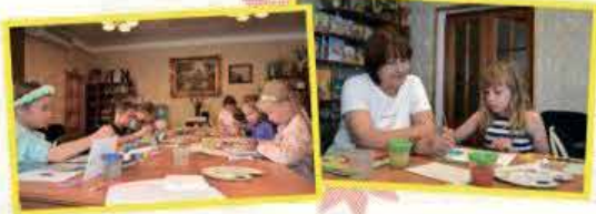
Гурток образотворчого мистецтва «Палітра»