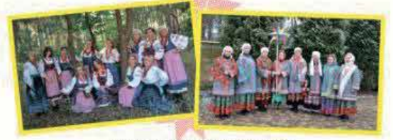
Аматорський театр пісні і танцю «Серпанок»