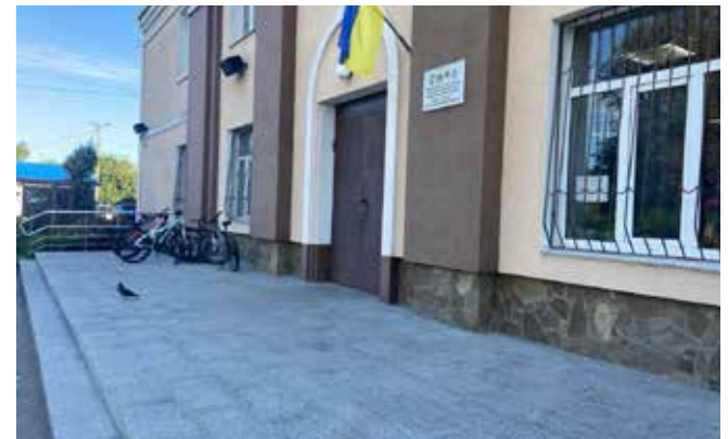
Відремонтовані сходи у Новопетрівському БК

• Сільський клуб у с. Гута-Межигірська (вул. Силкіна) — поточний ремонт фасаду, який було пошкоджено внаслідок ворожих обстрілів.