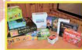
Клуб настільних ігор «Brous» тел. 093 418 62 09