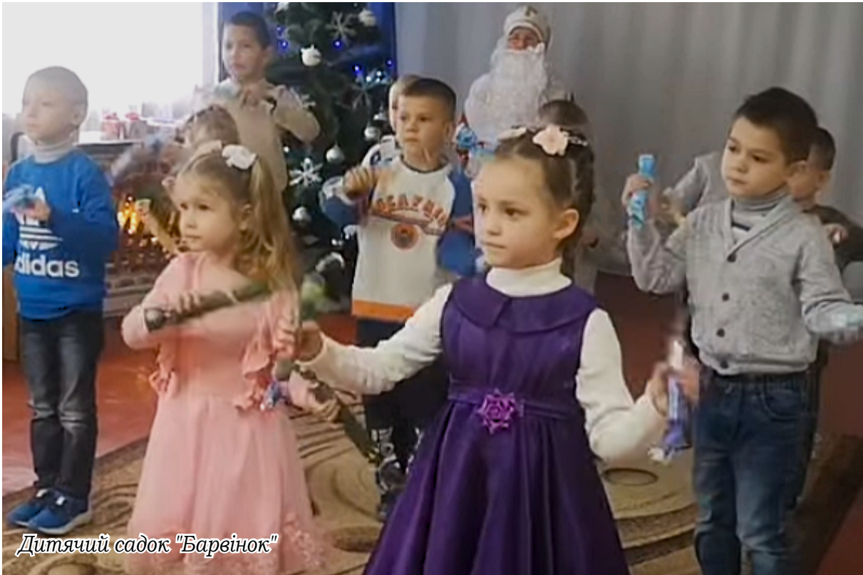
Дитячий садок "Барвінок"