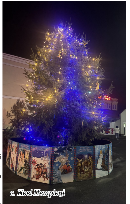
с. Носі Петрівці

Спочатку щедрувати було прийнято лише дівчатам, але з часом до цієї традиції долучилися й юнаки.