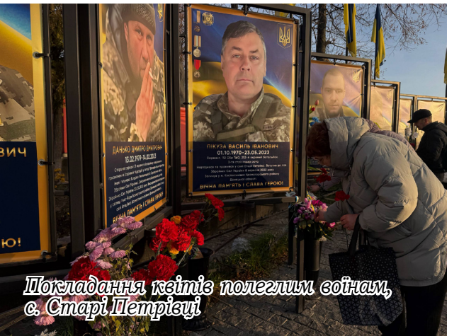
Покладання квітів полеглим воїнам, с. Старі Петрівці