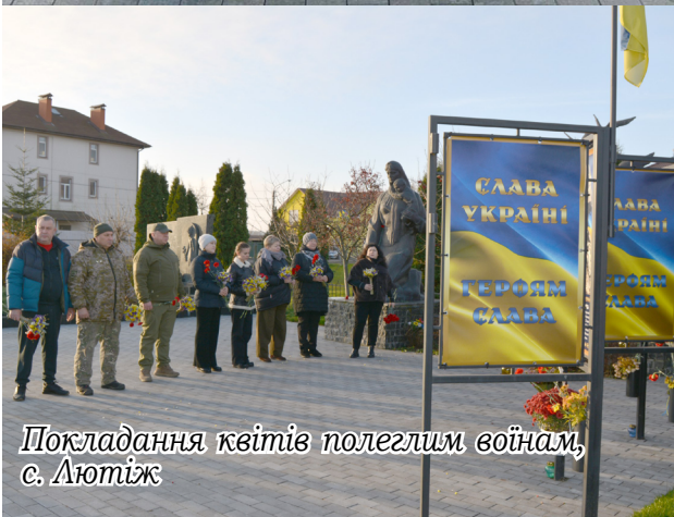
Покладання квітів полеглим воїнам, с. Лютіж