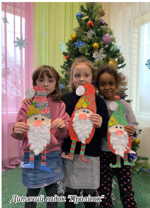
Дитячий садок "Пролісок"