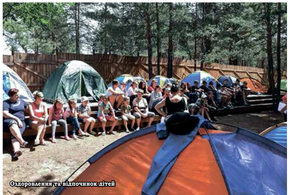
Оздоровлення та відпочинок дітей