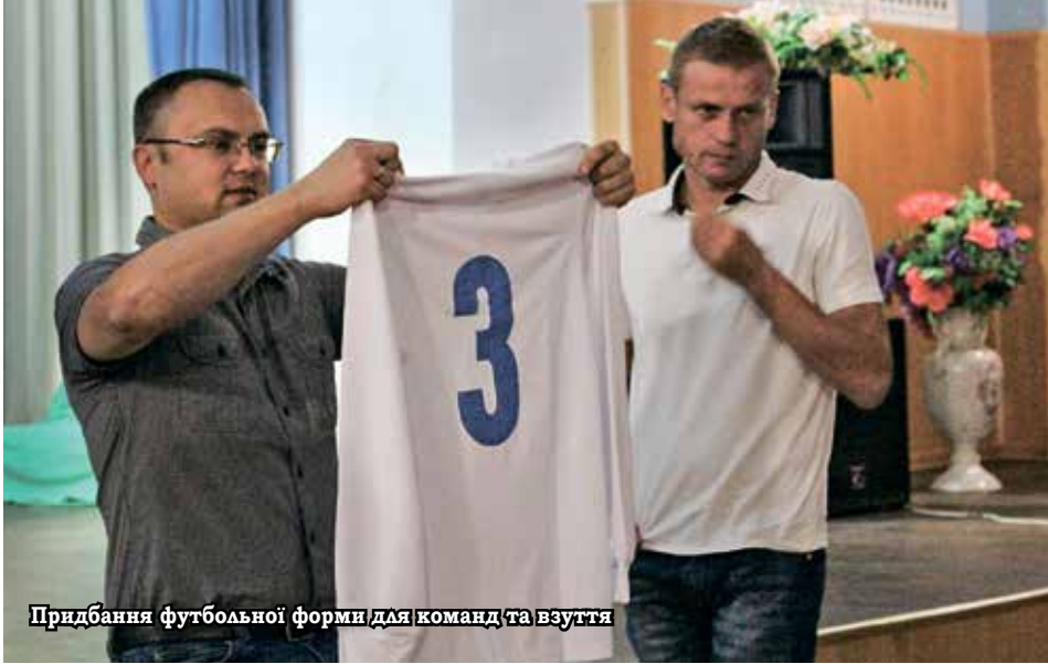
Придбання футбольної форми для команд та взуття