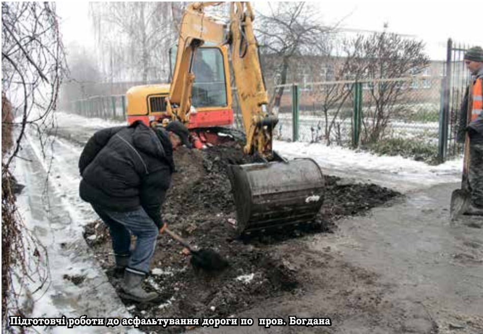
Підготовчі роботи до асфальтування дороги по пров. Богдана