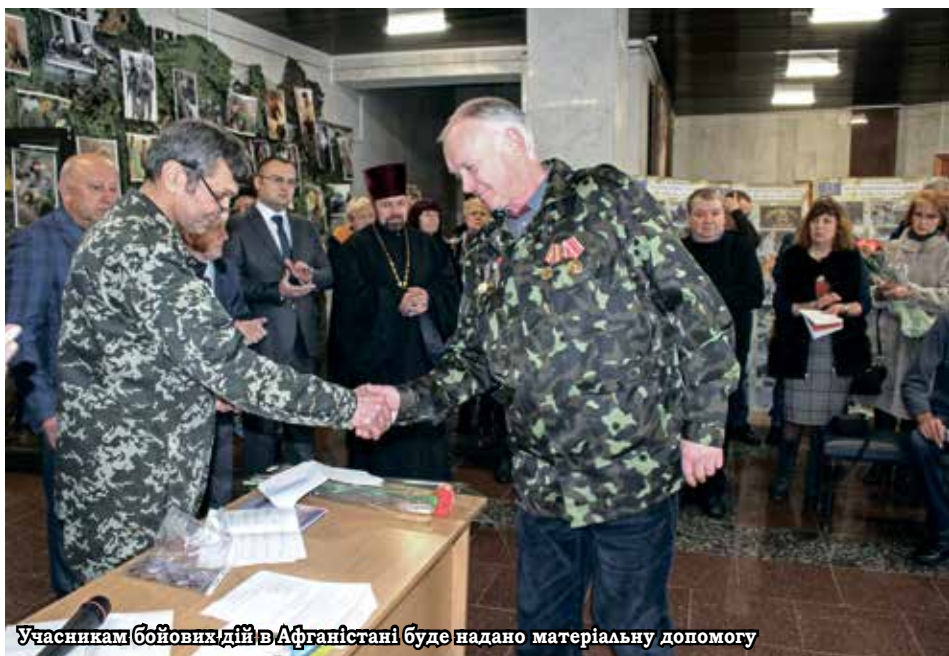
Учасникам бойових дій в Афганістані буде надано матеріальну допомогу