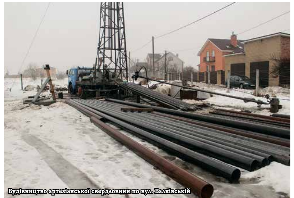
Будівництво артезіанської свердловини по вул. Валківській

• ямковий ремонт по вулицях: Миру, Валківська, Вишгородська,