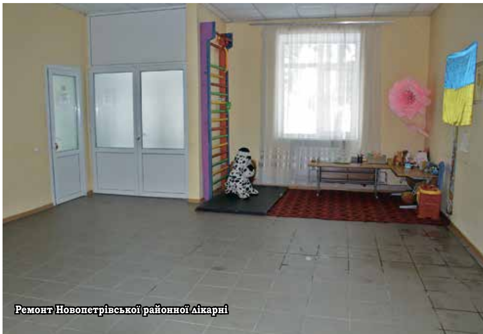
Ремонт Новопетрівської районної лікарні