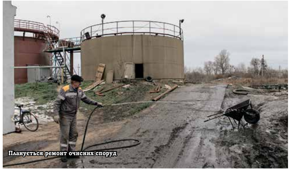
Планується ремонт очисних споруд