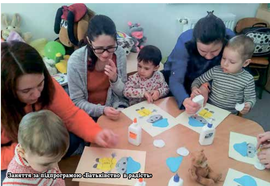
Заняття за підпрограмою «Батьківство в радість»