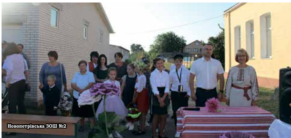
Новопетрівська ЗОШ №2