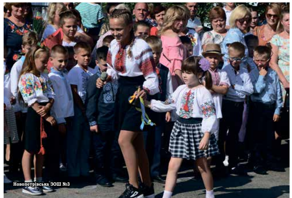
Новопетрівська ЗОШ №3