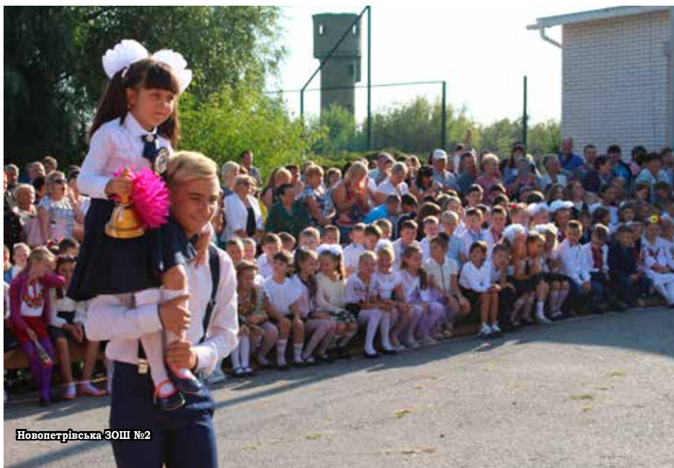
Новопетрівська ЗОШ №2

для першокласників, їх цього року сіло за парти новопетрівських шкіл – 118 дітей. Для першачків початок навчального року, звичайно, найзворушливіший, адже, залишивши дитячі садочки, вони розпочали новий етап свого життя – з портфеликами та буквариками, вирушивши у шкільну країну знань. Щоб знайомство з навчальним процесом для них не було стресовим, сільська рада також вирішила долучитися та організувати День першокласника. А допоміг у цьому Новопетрівський будинок ку. Захід проходив на території Національного музею-заповідника «Битва за Київ у 1943 році» у формі квесту, де діткам довелося відгадувати загадки, відповідати на запитання щодо казкових героїв, кружляти лабіринтами у пошуках наступного завдання. Було весело й гамірно. Наприкінці свята школярки отримали солодкі гостинці.