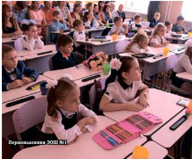
Першокласники ЗОШ №1

для першокласників, їх цього року сіло за парти новопетрівських шкіл – 118 дітей. Для першачків початок навчального року, звичайно, найзворушливіший, адже, залишивши дитячі садочки, вони розпочали новий етап свого життя – з портфеликами та буквариками, вирушивши у шкільну країну знань. Щоб знайомство з навчальним процесом для них не було стресовим, сільська рада також вирішила долучитися та організувати День першокласника. А допоміг у цьому Новопетрівський будинок ку. Захід проходив на території Національного музею-заповідника «Битва за Київ у 1943 році» у формі квесту, де діткам довелося відгадувати загадки, відповідати на запитання щодо казкових героїв, кружляти лабіринтами у пошуках наступного завдання. Було весело й гамірно. Наприкінці свята школярки отримали солодкі гостинці.