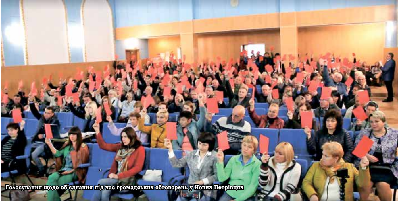
Голосування щодо об'єднання під час громадських обговорень у Нових Петрівцях

У державі набирає обертів децентралізація. Так зване «добровільне об'єднання» плавно переростає у примусове. Все більше розмов про потребу об'єднання громад у вищих структурах влади. Все йдеться до того, що обов'язково хтось з кимось мусить буде об'єднатися, адже як пояснюють це у вищих ешелонах влади, майбутні місцеві вибори мають пройти по новій системі,