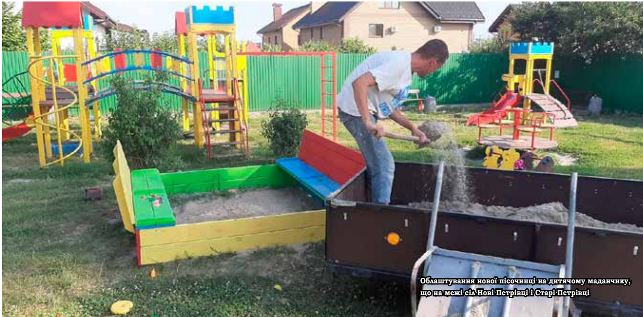
Облаштування нової пісочниці на дитячому майданчику, що на межі сіл Нові Петрівці і Старі Петрівці

Хочемо розповісти про ту роботу, яку проводилася протягом останнього місяця. На ділянці дороги по вулиці Валківській та від початку Ново-Київської до Польової змонтовано дренажні системи для водовідведення дощових вод.