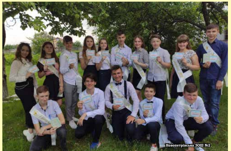
Новопетрівська ЗОШ №2