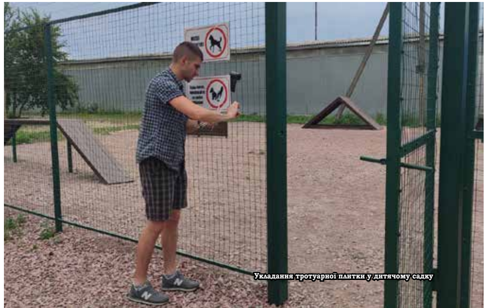
Укладання тротуарної плитки у дитячому садку