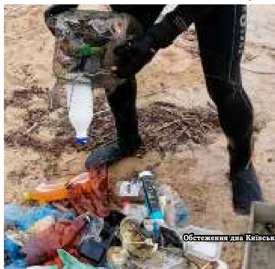
Обстеження дна Київського моря на пляжі «Труба»