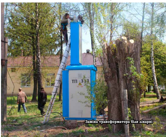
Заміна трансформатора біля лікарні