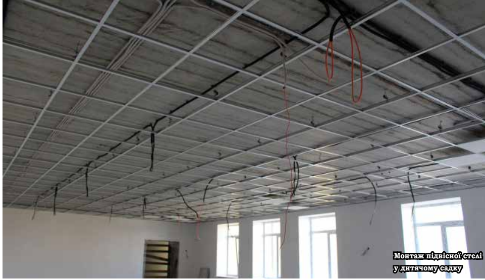
Монтаж підвісної стелі у дитячому садку