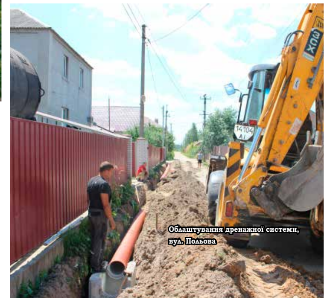
Облаштування дренажної системи, вул. Польова

Основні роботи з асфальтування доріг та заміни водопроводів плануються на кінець літа -початок осені.