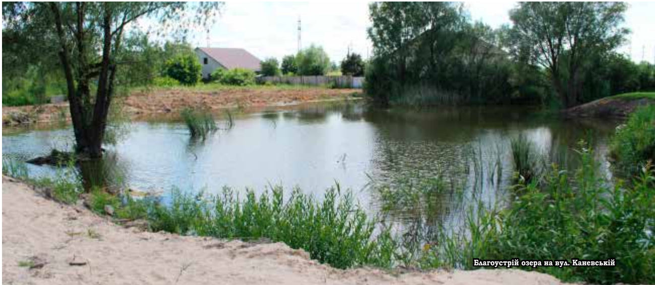
Благоустрій озера на вул. Каневській

Завершено поточний ремонт та фарбування дитячих майданчиків, у пісочниці завезено пісок. На кількох дитячих майданчиках встановлено нові ігрові елементи: пісочниці на Ново-Київській, Дачній та на межі між Старими і Новими Петрівцями; дві лавки на Ново-Київській. Також за спонсорські кошти докуплено ігрові елементи на майданчик, що по вулиці Князя Святослава, біля спуску до моря.