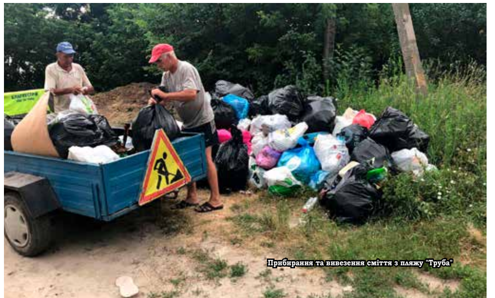
Прибирання та вивезення сміття з пляжу "Труба"