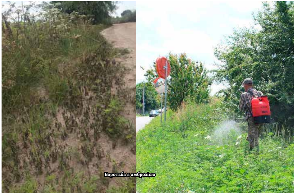
Боротьба з амброзією

Ремонт дороги Р-02 виконує підрядна організація ТОВ «Онур» на замовлення Служби автомобільних доріг у Київській області за державні кошти.