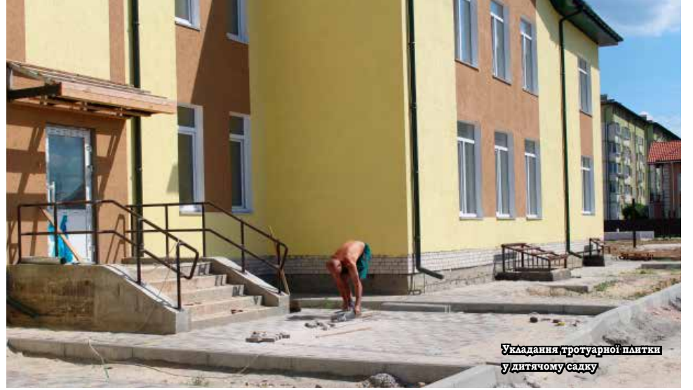
Укладання тротуарної плитки у дитячому садку