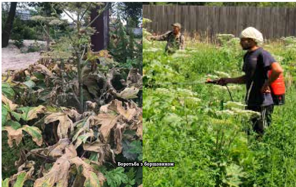
Боротьба з борщовиком