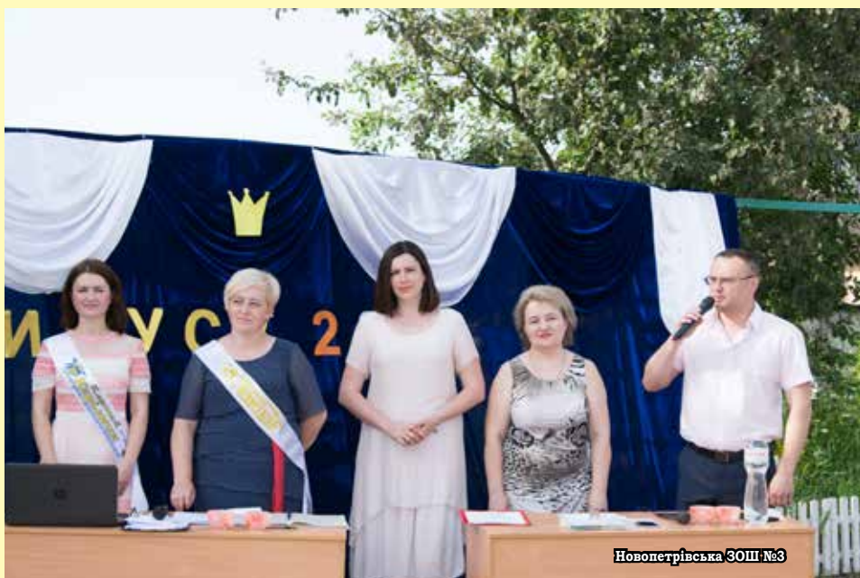
Новопетрівська ЗОШ №3