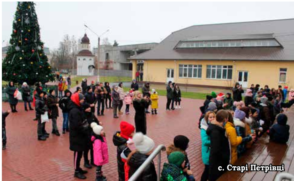
с. Старі Петрівці