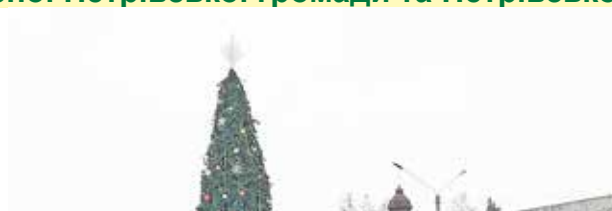
ЗАПАЛЕННЯ ВОГНІВ НА НОВОРІЧНІЙ ЯЛИНЦІ читайте на стор. 7