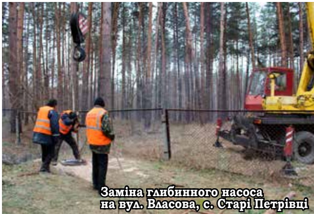
Заміна глибинного насоса на вул. Власова, с. Старі Петрівці