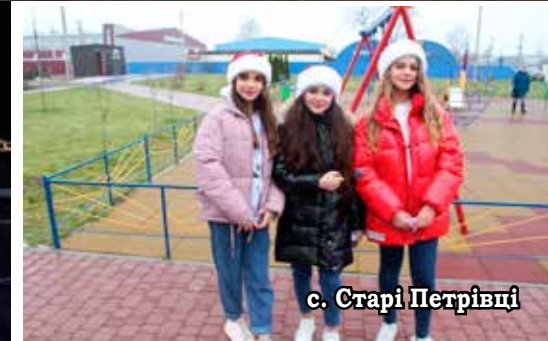
с. Старі Петрівці