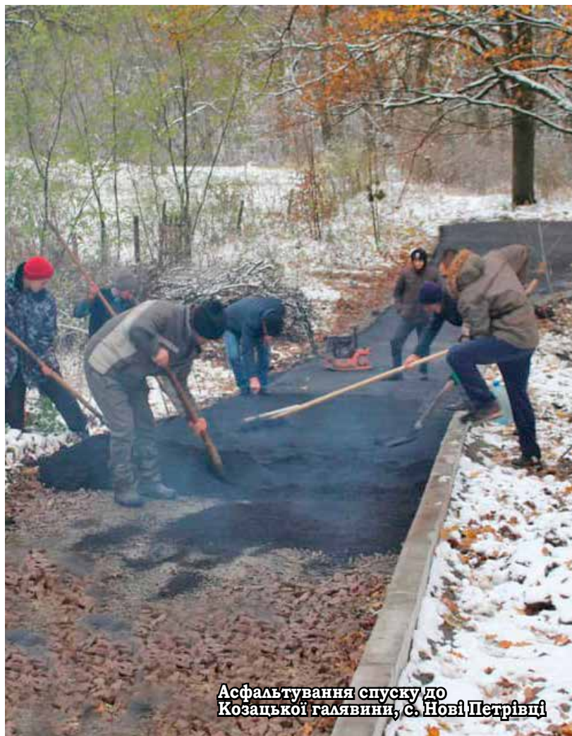
Асфальтування спуску до Козацької галявини, с. Нові Петрівці