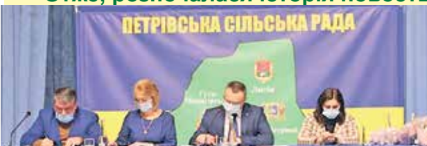
ПЕРШІ КРОКИ В РОБОТІ ПЕТРІВСЬКОЇ СІЛЬСЬКОЇ РАДИ читайте на стор. 2-4

Отже, розпочалася історія новоствореної Петрівської громади та Петрівської сільської ради!