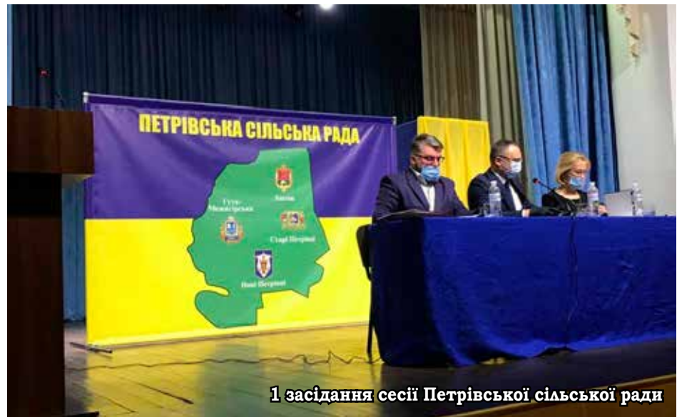
1 засідання сесії Петрівської сільської ради