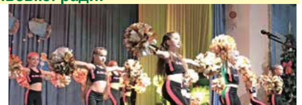
ТАЛАНТИ ПЕТРІВСЬКОЇ ГРОМАДИ читайте на стор. 6