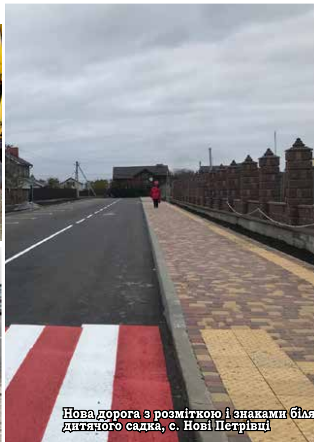
Нова дорога з розміткою і знаками біля дитячого садка, с. Нові Петрівці

Доводимо до відома жителів сіл Старі Петрівці, Лютиж та Гута-Межигірська, що найближчим часом господарям, які не дотримуються правил благоустрою (Закон України «Про благоустрій населених пунктів») будуть надіслані повідомлення (попередження) щодо приведення прилеглих до домогосподарств територій в належний стан. У першу чергу це складування на вулицях будівельних матеріалів, піску, ґрунту тощо, що є неприпустимим. В подальшому, тих хто не відреагує та не прибере дану територію, ми будемо притягати до адміністративної відповідальності шляхом накладення штрафів. Наступного року затвердимо відповідні Правила благоустрою, що діятимуть на території сіл громади, на основі тих, що діють сьогодні в Нових Петрівцях. Чистота та належний стан наших вулиць - це запорука благоустрою та привабливості нашої територіальної громади!