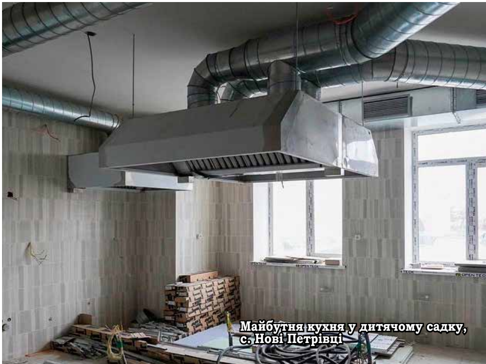
Майбутня кухня у дитячому садку, с. Нові Петрівці

Кінець 2020 року був перехідним періодом, тож виконання робіт в кожному окремо взятому селі нашої громади, проводилося ще відповідно до планів, затверджених колишніми сільськими радами нашої територіальної громади. Кожне село ще працювало з власного бюджету.