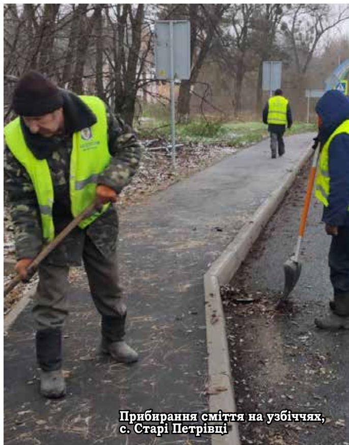
Прибирання сміття на узбіччях, с. Старі Петрівці