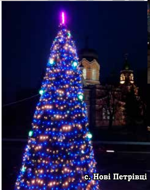
с. Нові Петрівці