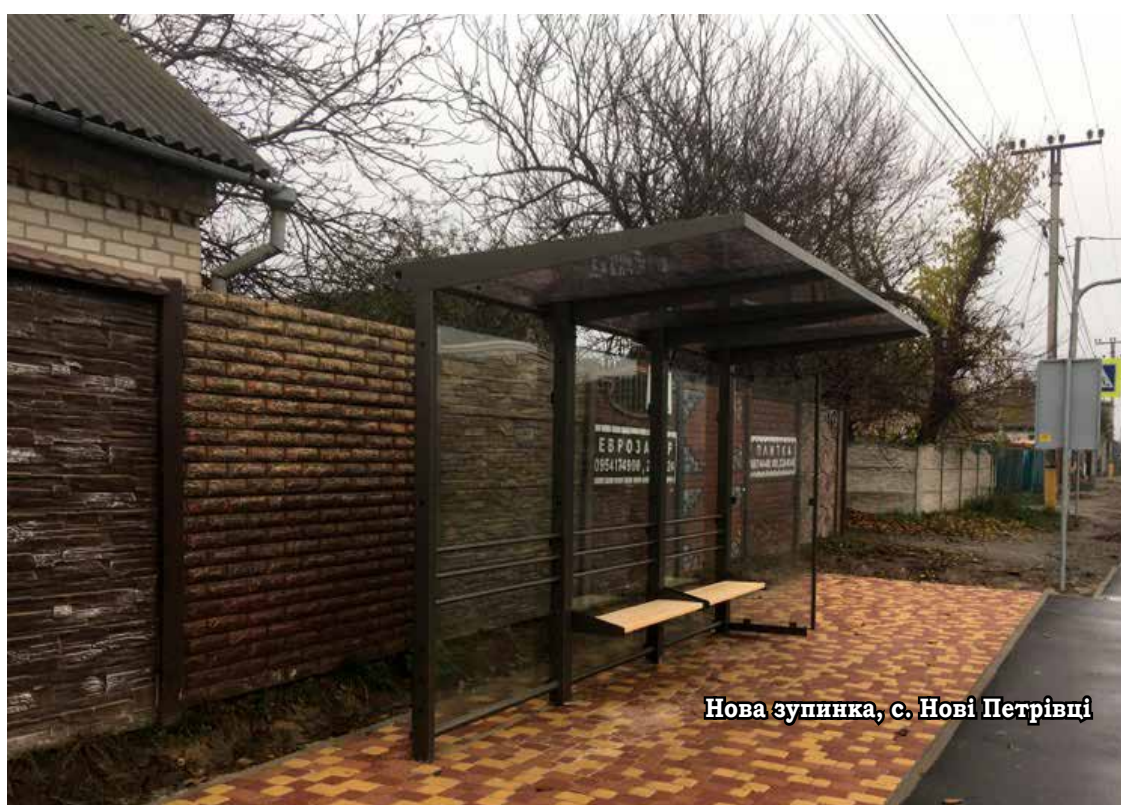
Нова зупинка, с. Нові Петрівці