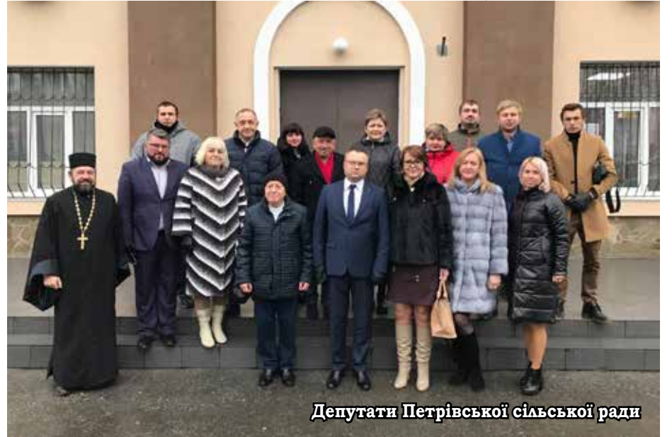
Депутати Петрівської сільської ради

Затверджено Порядок і нормативи відрахування до загального фонду сільського бюджету комунальними підприємствами, які належать до комунальної власності Петрівської сільської територіальної громади, частини чистого прибутку (доходу) за результатами щоквартальної фінансово-господарської діяльності у 2021 році.