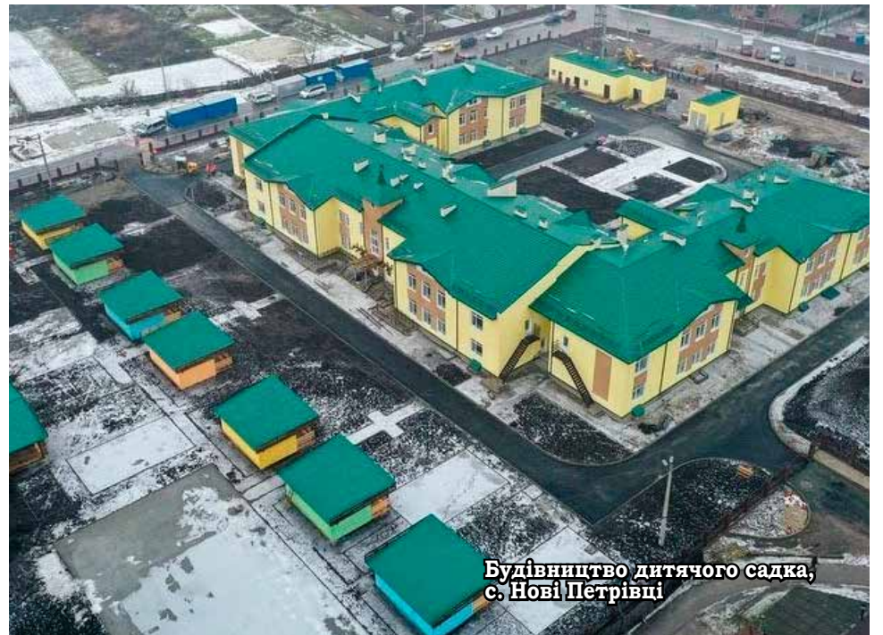
Будівництво дитячого садка, с. Нові Петрівці