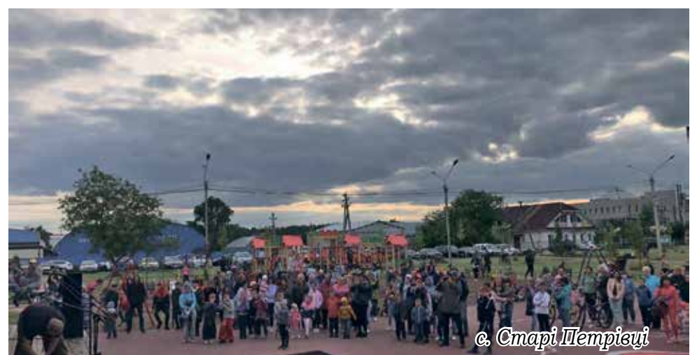
с. Старі Петрівці