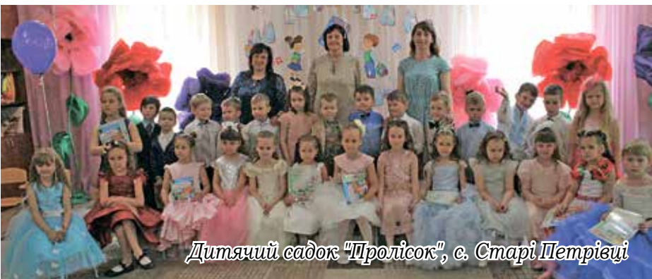
Дитячий садок "Пролісок", с. Старі Петрівці