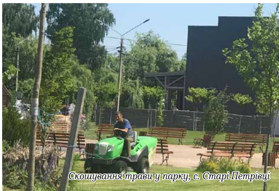
Скошування трави у парку, с. Старі Петрівці