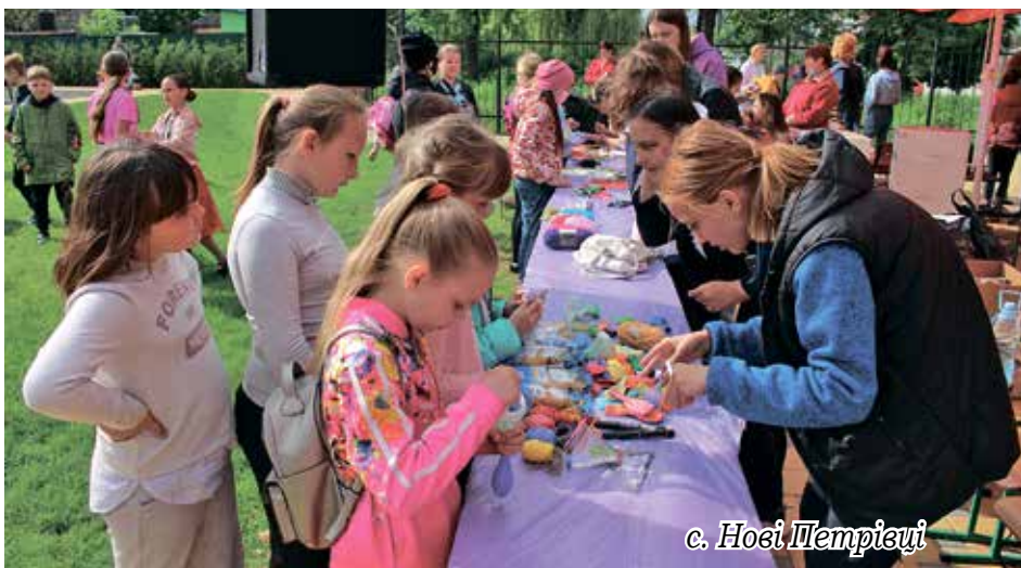
с. Носі Петрівці

Відзначення Дитячого дня покликане вселяти в серця наймолодших радість у теплому безпечному колі – в колі великої, злагодженої петрівської родини, в якій кожній дитині подарують посмішку і радість.