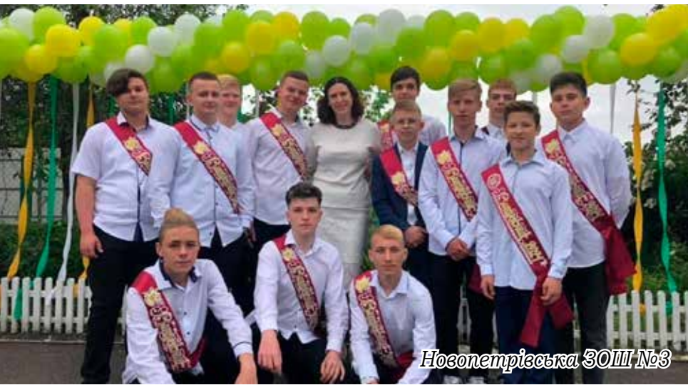
Новопетрівська ЗОШ №3

Найнезвичніше, мабуть, було у Лютізькій ЗОШ. На святі були присутні випускники 9-го та 11-х класів, їхні батьки і вчителі. Всі без винятку одягнені в стилі гангстерської вечірки. Поділившись на «клани», учасники заходу ходили по різних станціях, здобуваючи необхідний для перемоги ключ, яким безперечно виявився дзвоник, який і пролунав востаннє для випускників. Це було не лише дуже весело, а ще й пізнавально, адже у квесті доводилося не тільки вправлятися фізично, а й відповідати на ерудовані питання, підготовані директором школи.