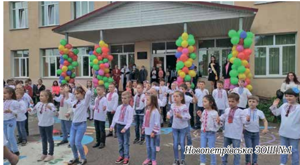
Новопетрівська ЗОШ №1

Приємно, що наші школи мають високе визнання. Так, на XII Між-