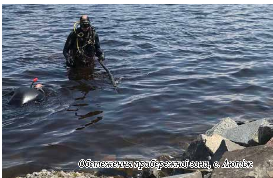
Обстеження прибережної зони, с. Лютеж