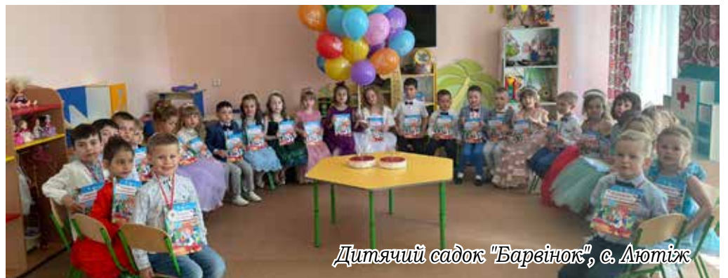
Дитячий садок "Барвінок", с. Лютіж