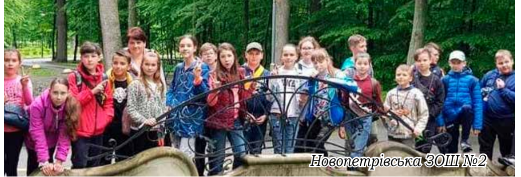
Новопетрівська ЗОШ №2