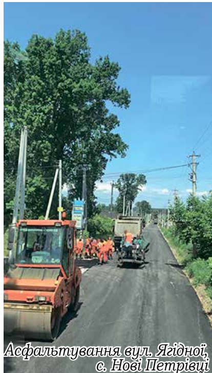
Асфальтування вул. Ягідної, с. Нові Петрівці

Грейдерування вул. Промислової, с. Старі Петрівці