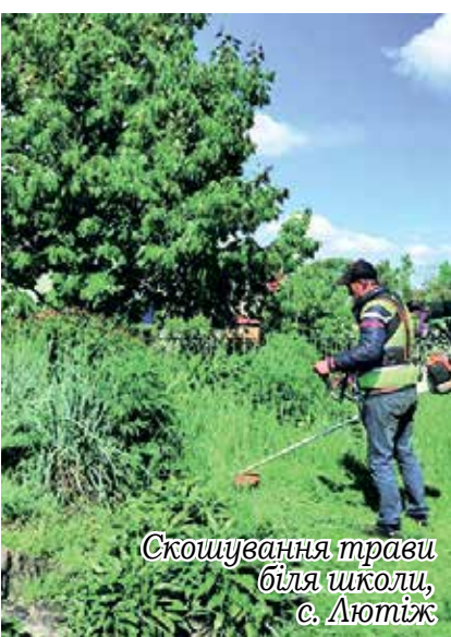
Скошування трави біля школи, с. Лютеж