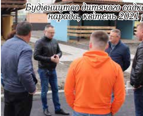
Будівництво дитячого садка, нарада, квітень 2021 р.

У 2021 році розпочато роботи по об'єкту «Капітальний ремонт водойми шляхом очищення донних відкладів та благоустрою с. Нові Петрівці» (розчищення та