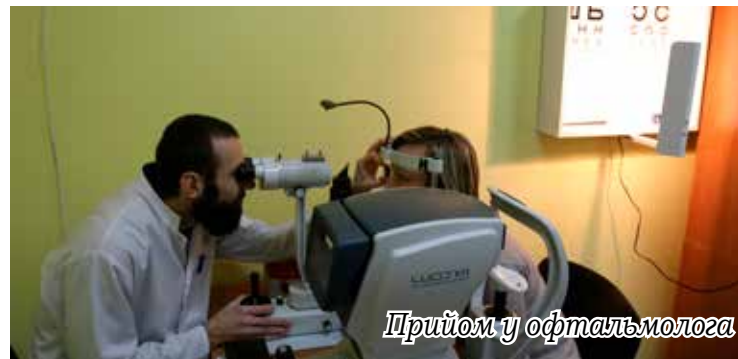
Прийом у офтальмолога

підрозділів закладу у 2021 році складає 120 відвідувань в зміну. У відділенні денного стаціонару у 2021 році проліковано 197 пацієнтів (в середньому 16 за місяць).