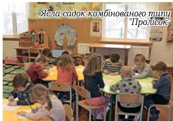
Ясла-садок комбінованого типу "Пролісок"

працюють над реалізацією проекту компаній Nestle та Veolia з питань поводження з відходами та роздільного сортування сміття «Lighthouse». У школах громади реалізуються інноваційні освітні проекти «Формування здорового способу життя та профілактика ВІЛ/СНІДу», «Школа як осередок розвитку громади», «Освіта для стійкого розвитку в дії», «Розвиток інклюзивної освіти