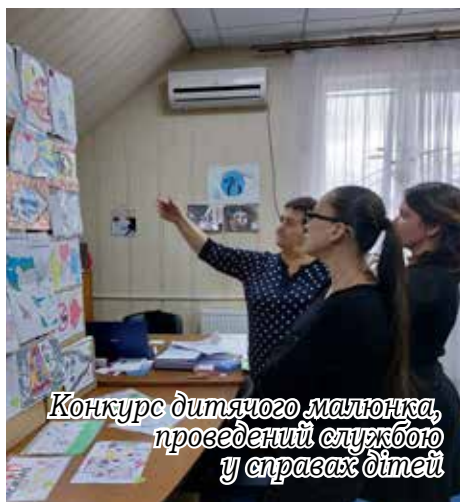
Конкурс дитячого малюнка, проведений службою у справах дітей

На первинному обліку служби перебувають: 26 дітей-сиріт та дітей, позбавлених батьківсько-