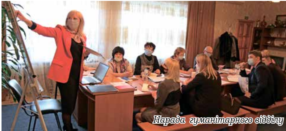
Нарада гуманітарного відділу

У 2020-2021 навчальному році маємо 6 переможців конкурсу-захисту учнівських робіт учнів-членів МАН та 3-х учителів, які їх підготували. Усі вони з 01 вересня 2021 до 31 серпня 2022 року отримують щомісячні стипендії Петрівської сільської те-