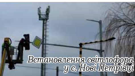
Встановлення світлофора у с. Нові Петрівці

8. Капітальний ремонт дороги по вул. Івана Франка в с. Лютіж.