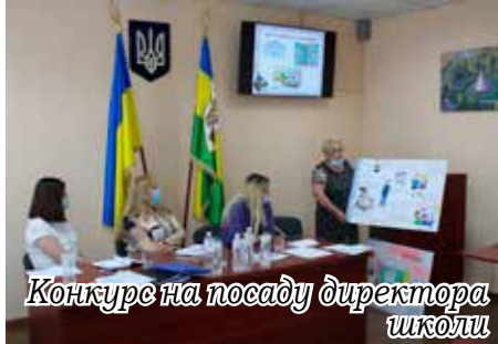
Конкурс на посаду директора школи

Освітня мережа Петрівської сільської територіальної громади складається із 5-ти закладів загальної середньої освіти і 3-х закладів дошкільної освіти (в т.ч. 1 заклад-новобудова). Всього учнів у школах громади станом на 05 вересня 2021 року – 2085 (на 76 більше, ніж у 2020-2021 навчальному році).