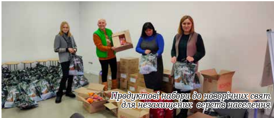
Продуктові набори до новорічних свят для незахищених верств населення

12 дітей-сиріт та 17 дітей, позбавлених батьківського піклування, виховуються опікунами та проживають у 20 сім'ях;