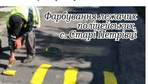
Фарбування лежачих поліцейських, с. Старі Петрівці

11. Капітальний ремонт пішохідної зони по вул. Приморська в с. Лютіж.