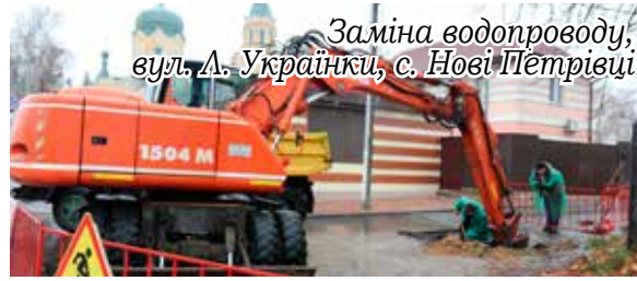
Заміна водопроводу, вул. Л. Українки, с. Нові Петрівці

За рік виходили з ладу та були замінені 10 насосів на свердловинах. У Нових Петрівцях - 4, в Ста-