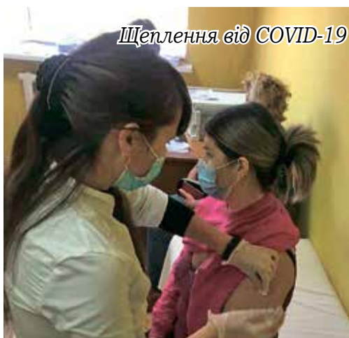
Щеплення від COVID-19

минулого року для Петрівського консультативно-діагностичного центру становить: заробітна плата – 7 361,3 тис. грн, витрати на придбання матеріалів і обладнання – 108,5 тис. грн, витрати на придбання медичних препаратів та медичного обладнання – 393,8 тис. грн, оплата комунальних послуг – 813,3 тис. грн.