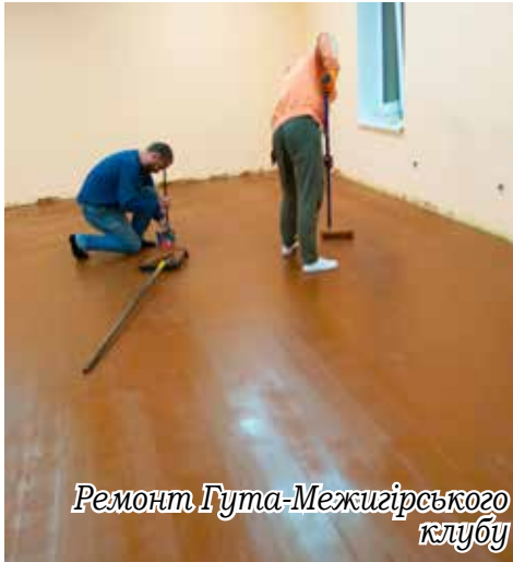
Ремонт Гута-Межигірського клубу

сільського клубу в с. Гута-Межигірська (заміна підлоги -154 м 2 , фарбування стін - 245 м 2 , заміна світильників - 26 шт., заміна електропроводки - 190 м).