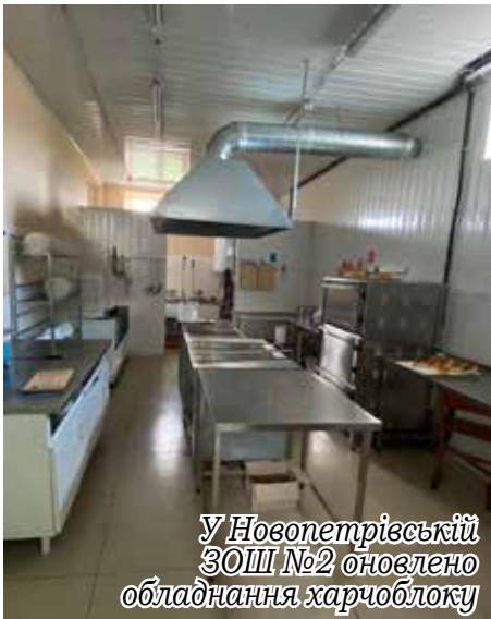
У Новопетрівській ЗОШ №2 оновлено обладнання харчоблоку

Інклюзивна освіта – важлива складова освітньої реформи. Створення гідних умов навчання дітей з особливими освітніми