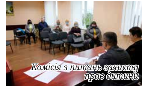
Комісія з питань захисту прав дитини

Для координації роботи суб'єктів соціальної роботи з метою вжиття невідкладних заходів для запобігання соціального сирітства, запобігання дитячої бездоглядності та профілактики правопорушень, протидії домашньому та гендерно зумовленому насильству служ-