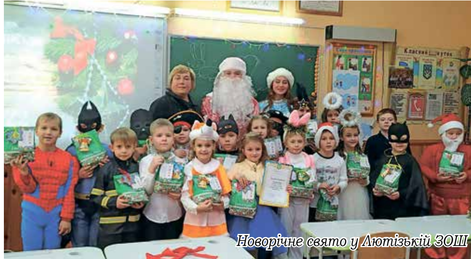
Новорічне свято у Лютізькій ЗОШ

У Новопетрівській ЗОШ №1 проведено ремонт харчоблоку (639,3 тис. грн), поточні ремонти комп'ютерного класу (99,5 тис. грн), системи опалення (49,9 тис. грн), спортивного майданчика зі штучним покриттям (71,9 тис. грн), придбано три інтерактивні дошки (150,0 тис. грн), холодильник у їдальню (19,9 тис. грн), закуплено комп'ютерну техніку (56,0 тис. грн),