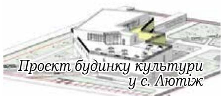
Проект будинку культури у с. Лютіж