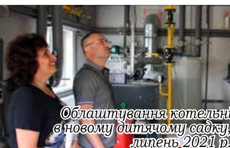
Облаштування котельні в новому дитячому садку, липень 2021 р.

благоустрій території оз. Канево в с. Нові Петрівці). Станом на 31.12.2021 виконано 10 % робіт. У 2022 роботи будуть продовжені. На реалізацію вказаного об'єкту Уряд надав субвенцію на соціально-економічний розвиток в розмірі 13,0 млн грн. Загальна вартість реалізації