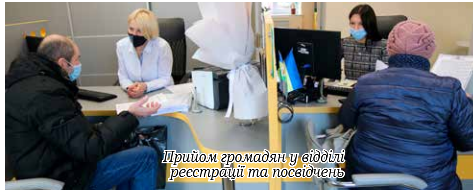
Прийом громадян у відділі реєстрації та посвідчень

Загалом по сільській раді всіма відділами видано майже 5,5 тис. довідок різного характеру (найбільше – це відділ реєстрації та