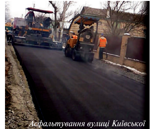
Асфальтування вулиці Київської

Таким чином, Новопетрівська сільська рада здійснює комплексний підхід для покращення рівня благоустрою нашого села та продовжує роботу в цьому напрямку.