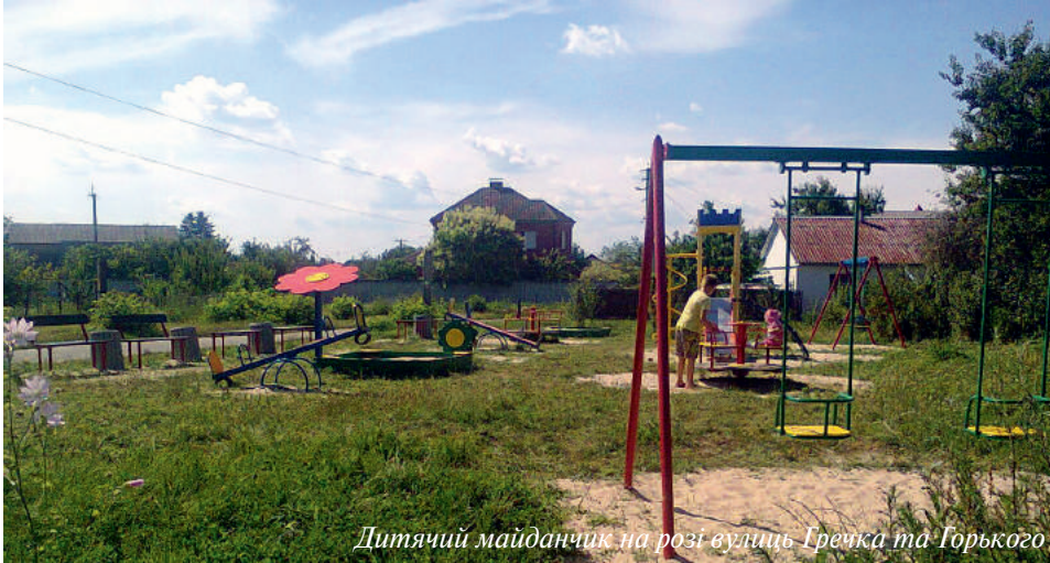
Дитячий майданчик на розі вулиць Гречка та Горького

спорту, інших об'єктів шляхом залучення підрядної організації.