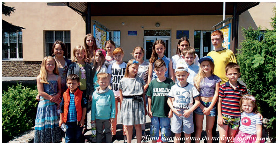
Діти вирушають до табору відпочинку

Вже другий рік суттєво фінансується «Програма соціального забезпе-