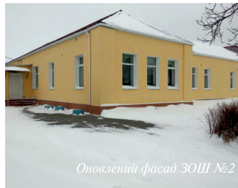
Оновлений фасад ЗОШ №2

Як і щороку, ми надавали допомогу закладам, які функціонують в нашому селі та утримуються за рахунок районного бюджету.