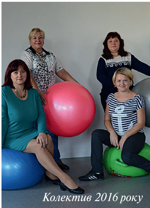
Колектив 2016 року