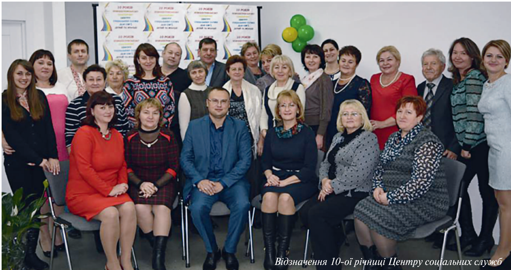
Відзначення 10-ої річниці Центру соціальних служб