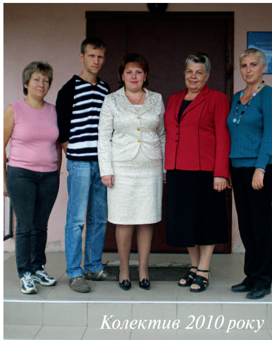
Колектив 2010 року

Цієї осені виповнилося 10 років від початку роботи Новопетрівського сільського центру соціальних служб для сім'ї, дітей та молоді. Цей заклад було створено для надання соціальних послуг дітям, молоді та сім'ям, які перебувають в складних життєвих обставинах, а також для профілактики правопорушень, для пропаганди ведення здорового способу життя та заохочення до відповідального батьківства.