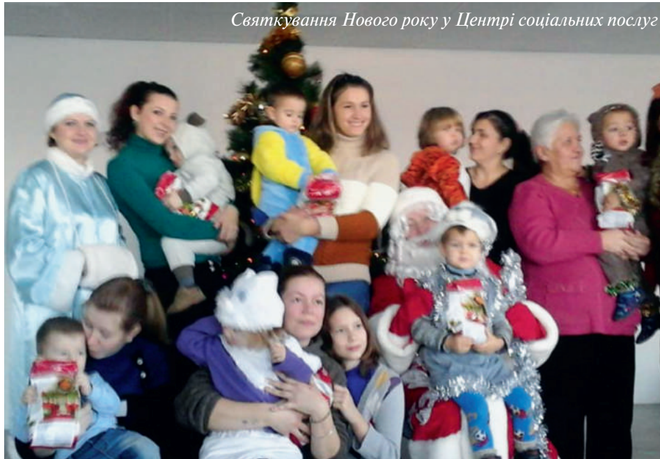
Святкування Нового року у Центрі соціальних послуг

11. Для дітей та осіб, які мають обмежені можливості, проводяться заняття за підпрограмою «Рівний серед рівних». Було проведено 8 занять та охоплено 4 дітей з особливими потребами, закуплено канцтовари для проведення занять.