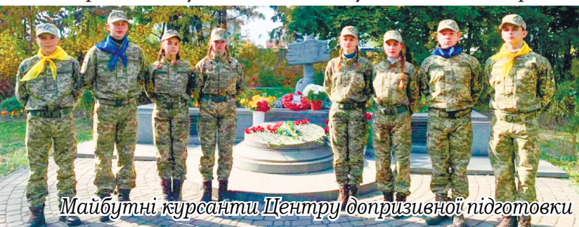
Майбутні курсанти Центру допризовної підготовки

Перед закладом відкриваються нові перспективи: зміцнюючи матеріально-технічну базу, забезпечити широкий спектр допрофільної підготовки учнів 7-9 класів та надавати ґрунтовні знання у профільній школі учням 10-12 класів, охоплювати змістовною позашкільною освітою через роботу різноманітних гуртків. Кадрове забезпечення та досягнення педагогів закладу дають змогу, враховуючи побажання батьків та здобувачів освіти, у новому навчальному році для учнів старшої школи організувати навчання за філологічним, природничо-математичним, суспільно-гуманітарним напрямками та створити групи української філології, математичного та історико-правового профілів. Адже кожного року маємо призерів та переможців різних етапів олімпіад та конкурсу-захисту МАН України. Не був винятком і минулий навчальний рік.