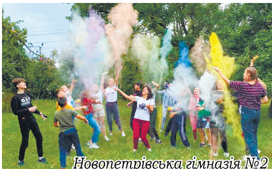
Новопетрівська гімназія №2

У новому 2022-2023 навчальному році школи громади працюватимуть за змішаною системою, використовуючи різні форми дистанційного навчання, з урахуванням запитів, потреб і бажань батьків. Детальніше про моделі організації освітнього процесу в громаді і в кожному закладі загальної середньої освіти